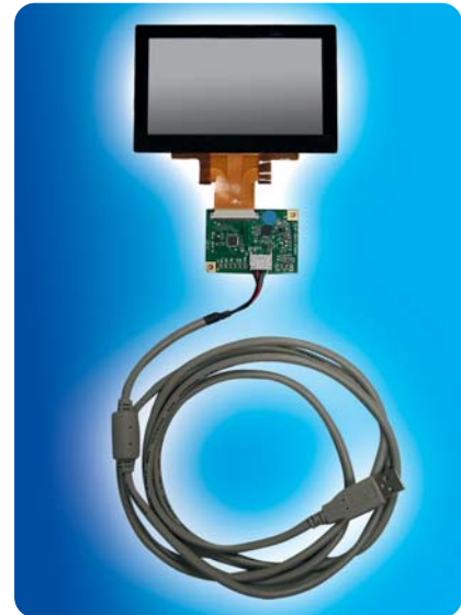
Der Touchscreen-Aufbau mit dem auf einer separaten Leiterplatte untergebrachten Controller.

Hy-Line Computer Components berät in allen Aspekten als Spezialist diejenigen, deren Aufgabe die marktreife Entwicklung eines Geräts mit den bereits erwähnten Anforderungen ist. Von den ersten Ideen über Entwürfe steht Hy-Line bei Mechanik-Konstruktion, Auswahl der Komponenten, Schaltungs- und Software-